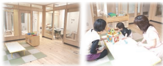
▲病児保育室ひだまり室内

ご家庭で利用されていない絵本やアニメDVDがございましたら、病児保育室へご提供ください。