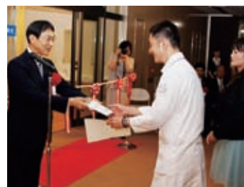
▲「ひだまり」命名者表彰式

■「子ども達に、少しでも、安らぎ、安心感を与えられる温かい場所でありたい、そして、子ども達に笑顔になってほしい」