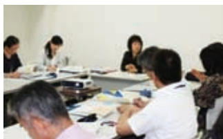
▲男女共同参画 広報・地域連携部門会議

第1回部門会議は、男女共同参画キャリア部門が5月14日、両立支援部門と男女共同参画広報・地域連携部門がそれぞれ5月16日、巨野原キャンパスにて開催されました。