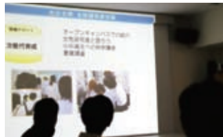
▲両立支援部門会議