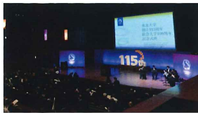
※昨年の東北大学創立115周年・総合大学100周年「記念式典・記念祭」の様子