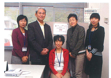
▲女性研究者サポート室スタッフ