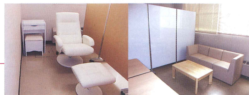
▲旦野原キャンパス

さらに 研究活動を進めていく上での不安や悩み等を相談できるような相談室の体制を整えていく予定です。